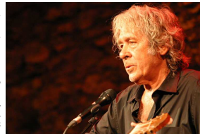
Paco Ibañez