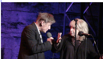
F. Solleville et A. Leprest